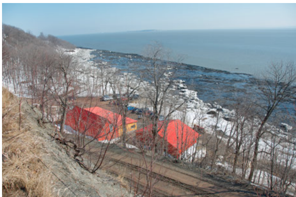
À la Sucrerie Blouin